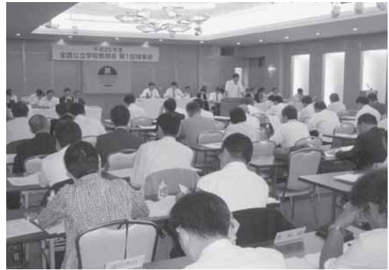
(写真は、理事会の様子)

今日は削減額の数値を示せないが、12月の理事会では削減の努力状況と来年度の予算について数値として示そうと思っておりますので、各方面での努力をよろしくお願いいたします。